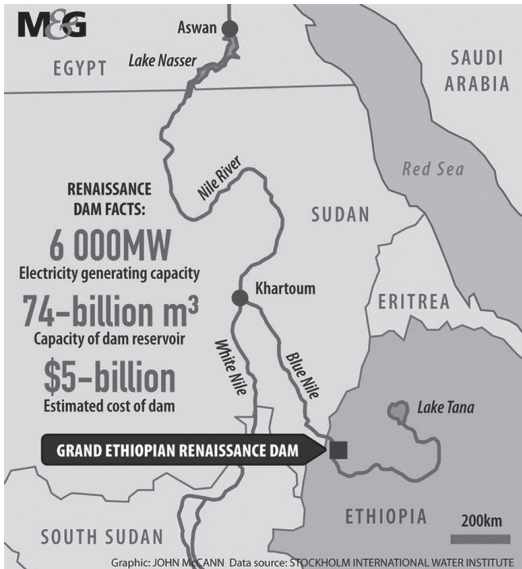
▲ Kép 2. A NERG környezete és alapvető adatai.

Az 1929-ben Egyiptom és a Nílus-parti, brit protektorátus alatt álló országok között jött létre egy szerződés, mely a Nílus vizének használatában Egyiptomnak kiemelt szerepet biztosít. Etiópia nem volt részese ennek a szerződésnek, amely telje-