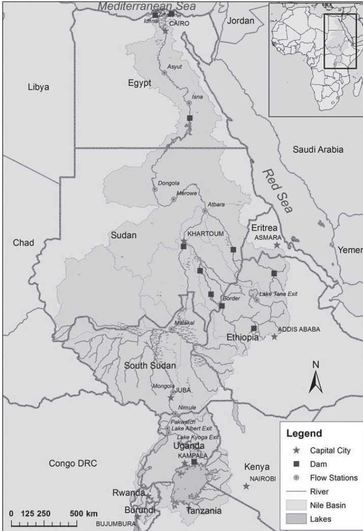
▲ Kép 1. A Nilus-medence térképe és a Nilus gátjai.

teltek – felépítését követően otthont ad majd Afrika legnagyobb vízierőművének, melyet a Gát mögötti hatalmas mennyiségű víz mozgási energiája táplál majd. Bár még csak 2011 óta épül, és a vízierőmű még nem állt szolgálatba, máris láthatók a projekt geopolitikai következményei, melyek Szudánra és a távoli Egyiptomra is hatással vannak. Úgy tűnik, hogy a Gát inkább pozitív hatással lesz Szudánra, ezzel szemben Egyiptomban a Gát az ország létét fenyegető kihívásként jelenik meg a politikusok és a társadalom fejében, ami kétségkívül hozzájárul a két távoli ország közötti feszültségekhez.