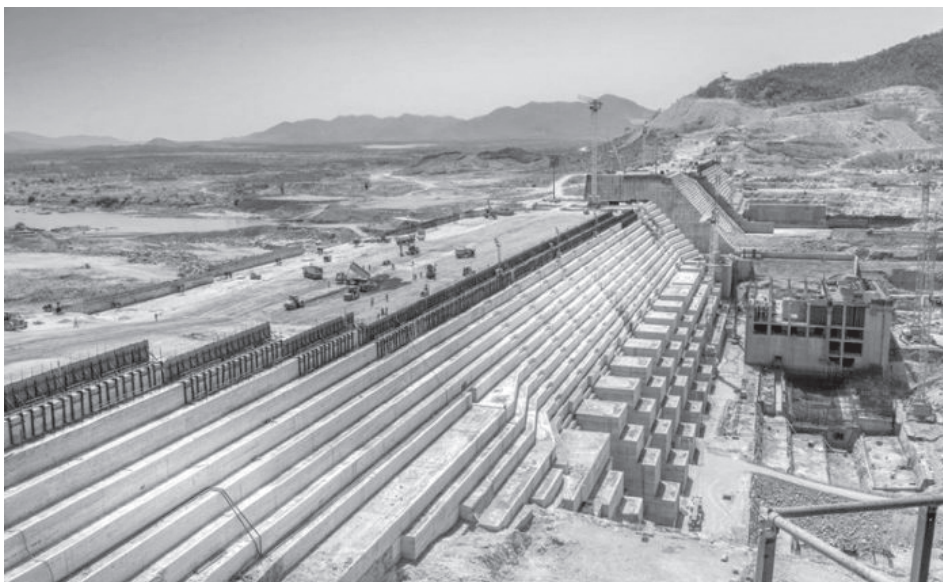
▲ Kép 5. A NERG építése.

A legújabb fejlemények Szudánban (rendszerelváltás), azonban természetesen bonyolítják a helyzetet, mivel az etióp terv szerint NERG erőművének teljes kapacitása 6500 MW villamos energia lesz, amelyből 2000 MW-ot exportra szánnak ahhoz, hogy a projekt költségei megtérüljenek. Ezen többletenergia első számú felvevője a tervek szerint Szudán, de a jelenlegi politikai és társadalmi bizonytalanság közepette van esély arra, hogy az ország nem lesz képes megvásárolni ezt a mennyiséget, ha majd a vízierőmű üzembe áll.