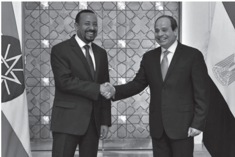
▲ Kép 3. Abij Ahmed és Abdel Fatah el-Sziszí Kairóban, 2018 júniusában.

tomi jelenlétének ellensúlyozása is motiválja (geopolitikai ok). Gazdasági érdekek között említhetők a lehetséges befektetési lehetőségek Egyiptomban és Etiópiában (mind államközi, mind magán, mind pedig szervezeti alapon, az IMF és a Világbank által). Azt sem szabad elfelejteni, hogy az etióp lobbí a második legnagyobb afrikai lobbí az Egyesült Államokban, ezért Trump elnöknek nem lehet mellékes az sem, hogy nagyobb aktivitást mutasson az Afrika Szarvát illető politikai és gazdasági kérdésekben a 2020-as választási kampány részeként.